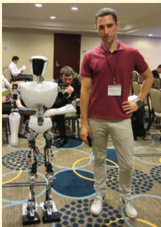
» Robot CHARLI s Virginia Tech Sveučilišta koji je 2011. pobijedio na svjetskom prvenstvu robota u nogometu

od strane Europske unije. Mi smo sada zahvaljujući tvrtki ABB dobili industrijskog robota IRB 120, a zahvaljujući tvrtki Denso još jednog većeg industrijskog robota. Tvrtka Siemens nam je donirala najsuvremeniji sustav za zaštitu na radu, a u suradnji s tvrtkama Servotech i Tipteh razvili smo modernu fleksibilnu robotsku ćeliju s transporterima i mogućnošću za kolaborativni rad robota. U našem laboratoriju će sada studenti imati mogućnost vidjeti, ali i raditi s pravim hardverom.