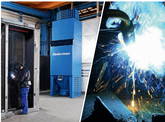
» Primjer uporabe stupa za čišćenje zraka

Stup će očistiti zrak i koncentraciju plinova zavarivanja održavati koliko je to moguće nisko. S pomoću naprednih računalnih simulacija usavršili smo dizajne jedinice i razvili smjernice za optimalne parametre uređaja.