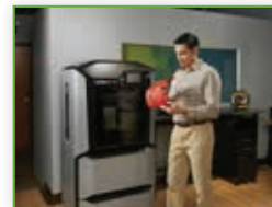
118 Izrada alata za toplo oblikovanje 3D printanjem