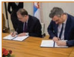
35 Za čvršće veze znanosti i gospodarstva