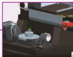
196 Brza izrada zahtjevnih proizvoda