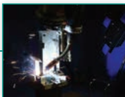
132 Zavarivanje u skućenim prostorima