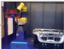
8 Radionica o 3D mjeriteljstvu u procesima oblikovanja lima