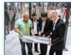
212 Snižavanje temperature – povećanje iskoristivosti