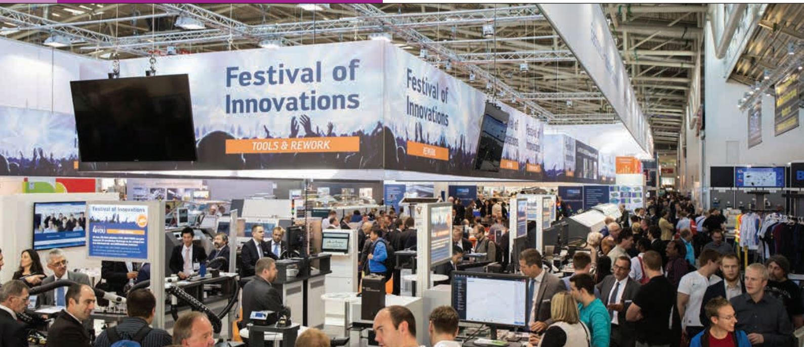
» Razvoj i proizvodnja elektronike: sajam Productronica 2015. u Münchenu