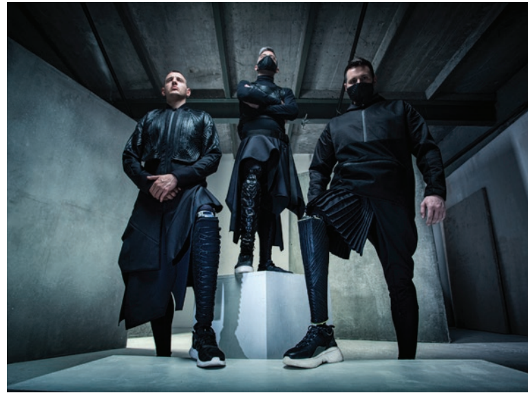
» Pirate Art Studio - YASUKENEO kolekcija, inspirirana prvim afričkim samurajem.

Ostojić i zajedno s Dankom i Oljom stvorene su prve 4 kolekcije koje su krajem ljeta predstavljene tržištu. Ideja je da u budućnosti surađujemo s različitim modnim dizajnerima u stvaranju kolekcija i tako postanemo prvi proizvođači estetskih obloga koji su povezani s modnom industrijom.