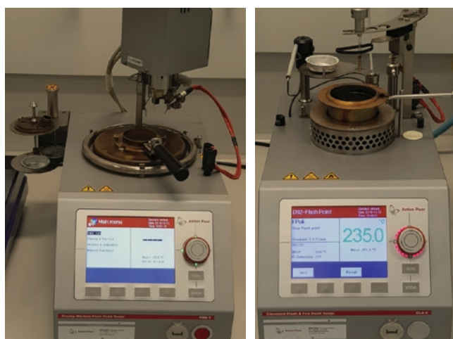
» Slika 1: Određivanje plamišta u otvorenoj (lijevo) i zatvorenoj (desno) posudi

Izvještaj o rezultatima analize mora sadržavati podatke, iz kojih je nedvojbeno razvidno, na koji uzorak maziva se odnosi. Preporuča