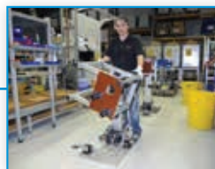
183 Radna mjesta maksimalno efektivna i učinkovita