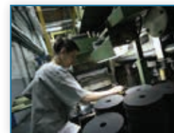
206 Znaju, kako do svjetskog vrha