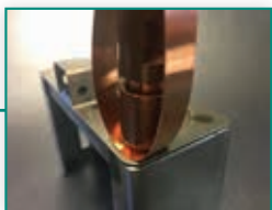
122 Otporno točkasto zavarivanje aluminijske legure sa čelikom uz primjenu među-folije