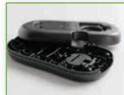
96 Kontrola tlaka u kalupnoj šupljini