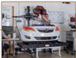
10 Topomatika slavi 15 godina uspješnog poslovanja