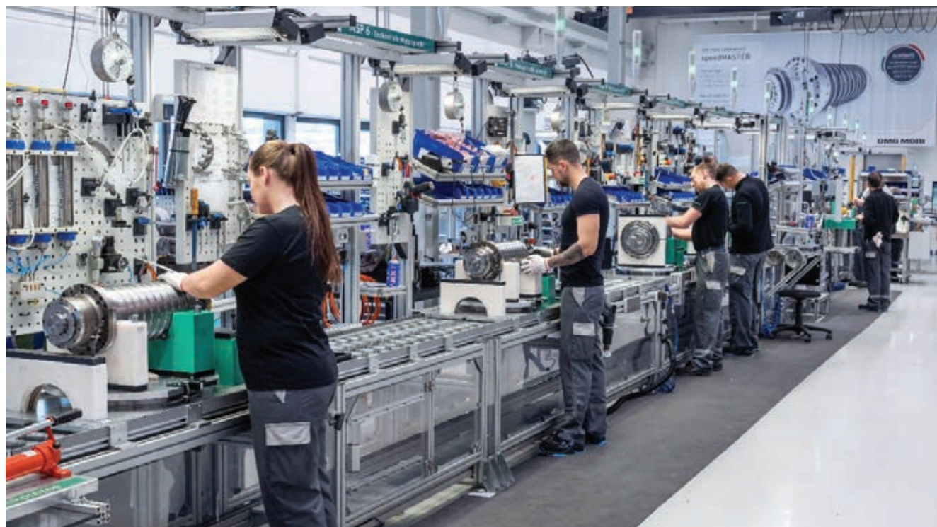
» 11.000 MASTER vretena koja svake godine napuštaju naše tvornice, jasna su potvrda zadovoljstva kupaca DMG MORI servisom vretena.

Mi naš servis nudimo za sve strojeve – i tehničku podršku i zamjenske dijelove. Naši kupci očekuju apsolutnu pouzdanost, maksimalnu točnost i izdrživost dijelova. Sto posto zadovoljan kupac je prioritet u DMG MORI. Svaki pojedini kupac je za nas važan, pa stoga i njegova oprema.