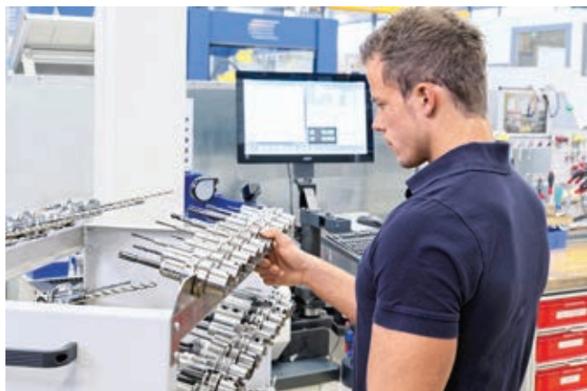
» Po prednastavitvi orodij se celoten voziček premakne k obdelovalnemu stroju.