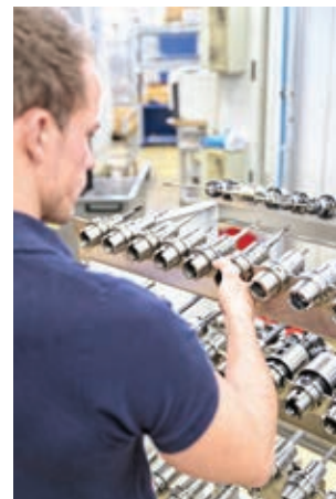
» Sestavljena orodja so urejena tako, da je zagotovljeno varno ravnanje z njimi.