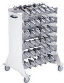
» SCHUNK kompakten voziček za orodja ponuja prostor za do 156 sestavljenih orodij.