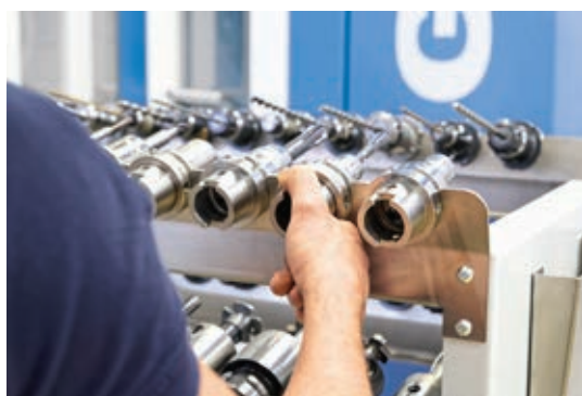
» Ker so adapterji orodnih sestavov prosto dostopni, se nevarnost ureznin praktično odpravi.