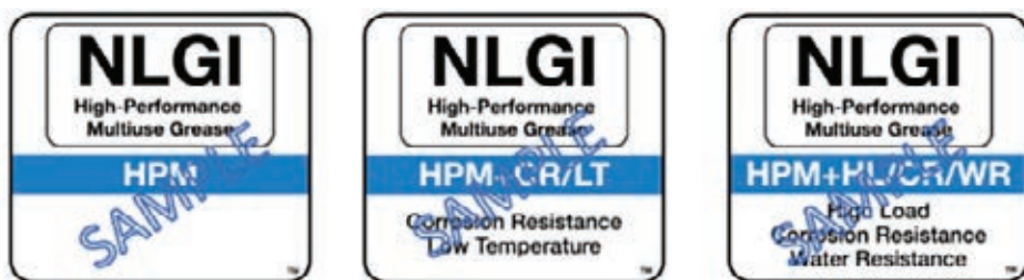
» Slika 3: Primjeri oznaka sa certifikatom HPM [1]