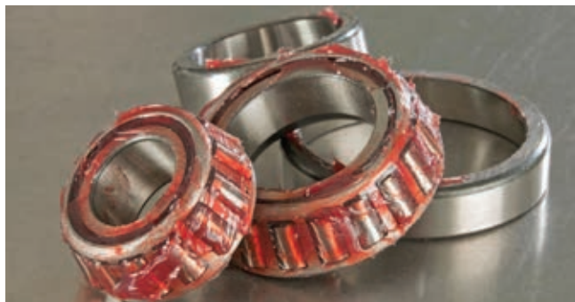
» Slika 1: Jedan od mitova o mastima za podmazivanje: »crvena mast je najbolja« [2]

U ovom članku ćemo ovaj posljednji mit detaljnije objasniti. Istina je, da je moguće višenamjenske masti izraditi s različitim zgušnjavajima, različitim viskoznošćama baznog ulja i različitim kombinacijama aditiva. Zbog mogućih kombinacija to u velikoj mjeri osigurava raspon učinkovitosti višenamjenskih maziva. Ne postoji industrijska specifikacija za »višenamjensku« mast, koja bi standardizirala učinkovitost. Barem do sada [1].