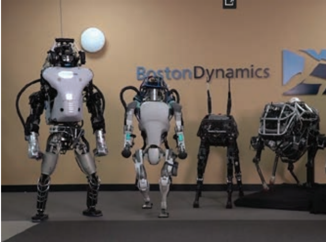
» Slika 1: Predstavitev hidravličnih robotov podjetja Boston Dynamics.

povezanimi z razvojem Industrije 4.0. Za razliko od preteklih konferenc je bilo veliko prispevkov s področja tribologije v hidravliki, saj so bili organizirani kar trije sklopi, ki so se navezovali na tribološke analize v hidravliki. Posebnost v okviru konference je bila predstavitev podjetja Boston Dynamics in predstavitev robotov, ki se sinergetsko razvijajo skupaj s hidravličnimi in pnevmatskimi komponentami (slika 1).