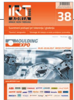
Slika na naslovnici: Messe Stuttgart